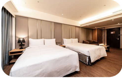
高雄鮪魚家族飯店