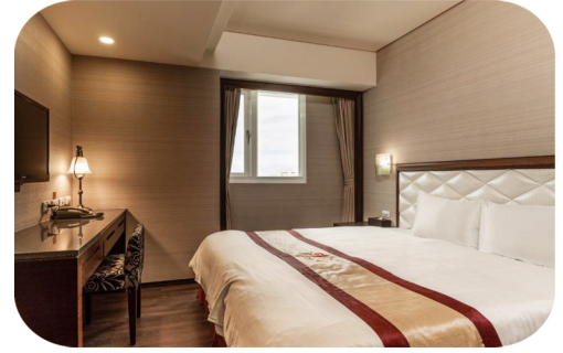
台東鮪魚家族飯店