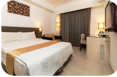
花蓮鮪魚家族飯店